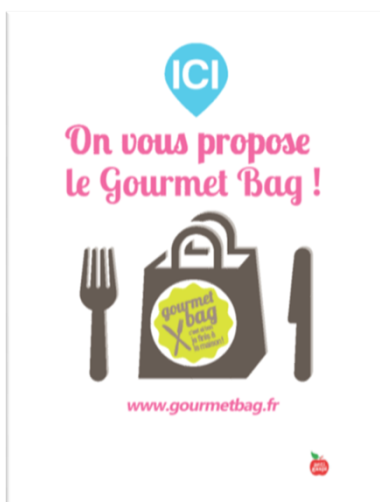
Chevalets pour les tables