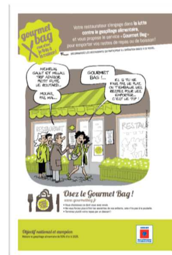
Planche de jeux