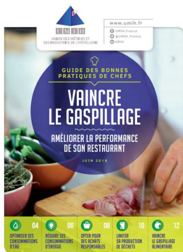
Guide des bonnes pratiques de chefs : Vaincre le gaspillage (UMIH, juin 2018)