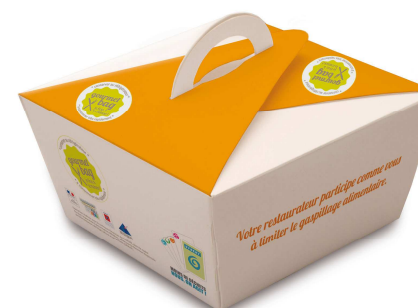
Boîtes en carton alimentaire